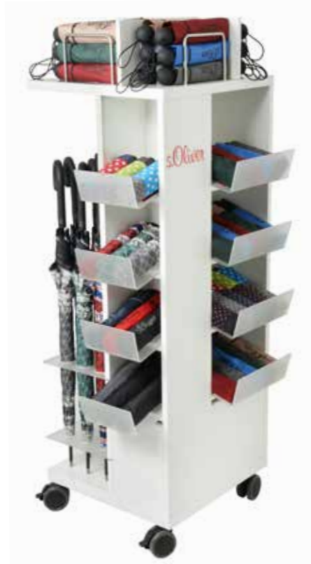
ART. NR. 862999SO L45/B45/H140 cm Bestückung: 96 Minischirme mit oder ohne Automatik 18 Stockschirme