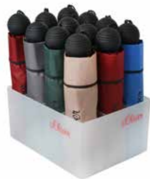
ART. NR. 78256SO L23,5/B17,5/H12 cm Bestückung: 12 Minischirme mit oder ohne Automatik