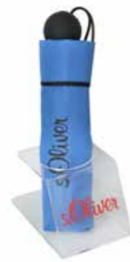
ART. NR. 86102SO Bestückung: 1 Minischirm mit oder ohne Automatik