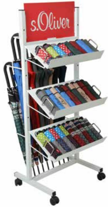
ART. NR. 861999SOK L53/B50/H135 cm Bestückung: 72 Minischirme mit oder ohne Automatik 24 Stockschirme